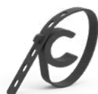
Orbit TUTORI PER ALBERI